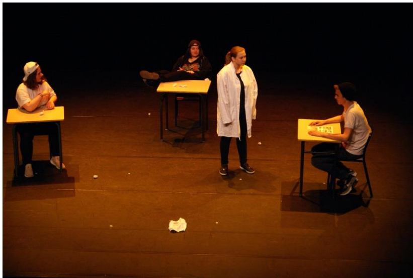
Mise en scène de « Pinocchio » en Mai 2019