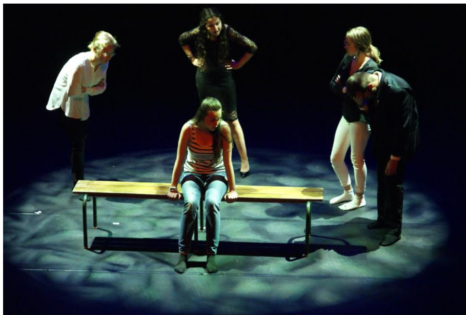
Mise en scène de « Cendrillon » en Mai 2019